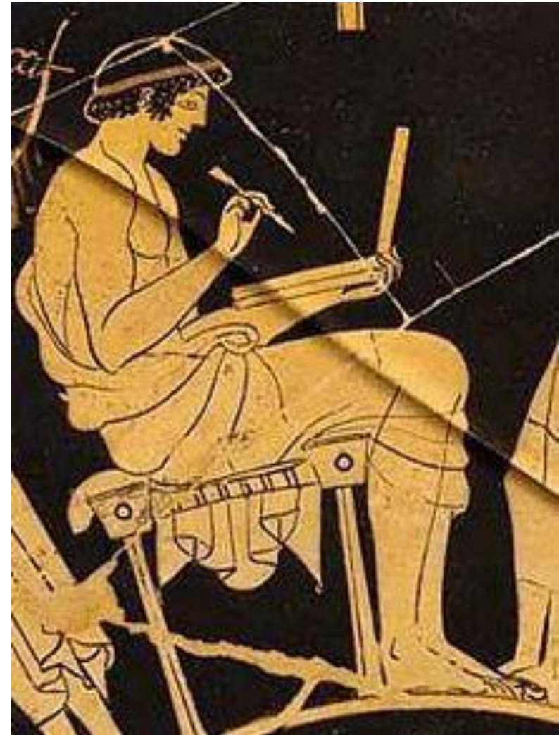
Raudonfigūrė vaza – berniukas mokykloje, rašantis lentelėje ~490–485 pr. Kr. (Dailininkas Duridas, Berlyno valstybinis muziejus)